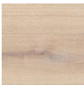
6111 Blanco transparente