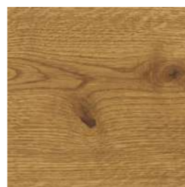
6141 Havana transparente