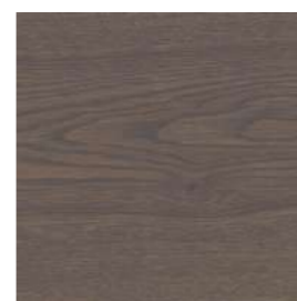
6114 Grafito transparente