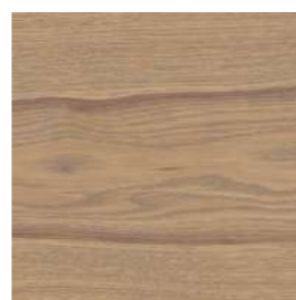
6112 Gris plata transparente