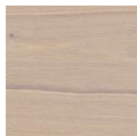
6118 Gris claro transparente