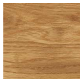
6100 Incoloro mate