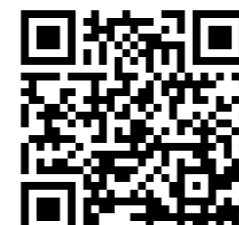
Video del producto